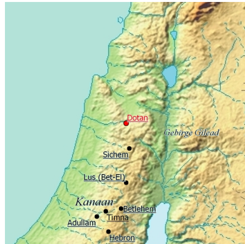
Hebron – Dotan